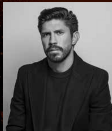
Oribe Peralta Futbolista Profesional